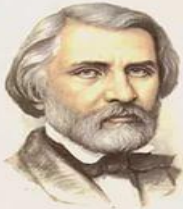
Иван Сергеевич Тургенев

«Счастье – как здоровье: когда его не замечаешь, значит, оно есть»