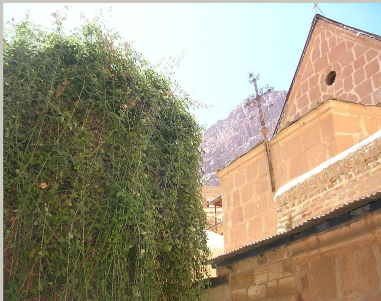
Неопалимая купина в монастыре Святой Екатерины

С Его именем идут в огонь и побеждают стихию.