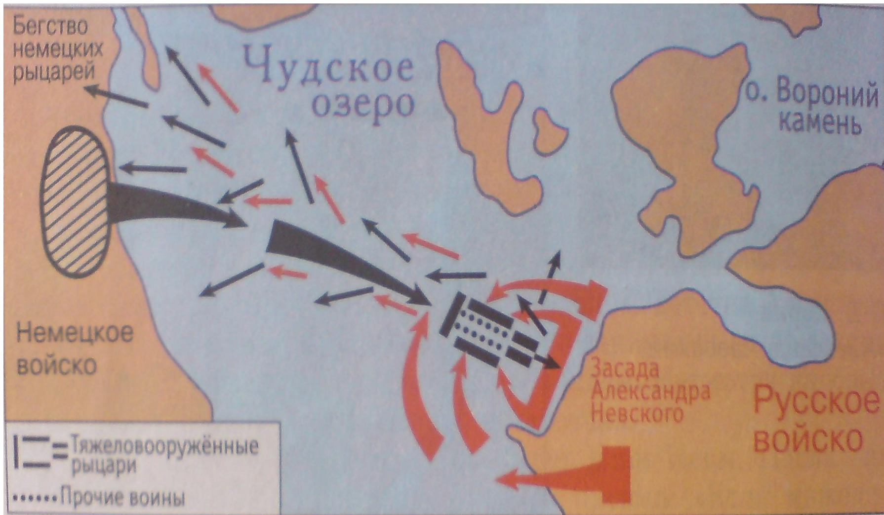
План-карта Ледового побоища