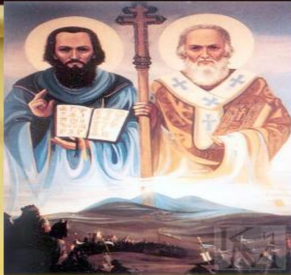
Святые равноапостольные Кирилл и Мефодий