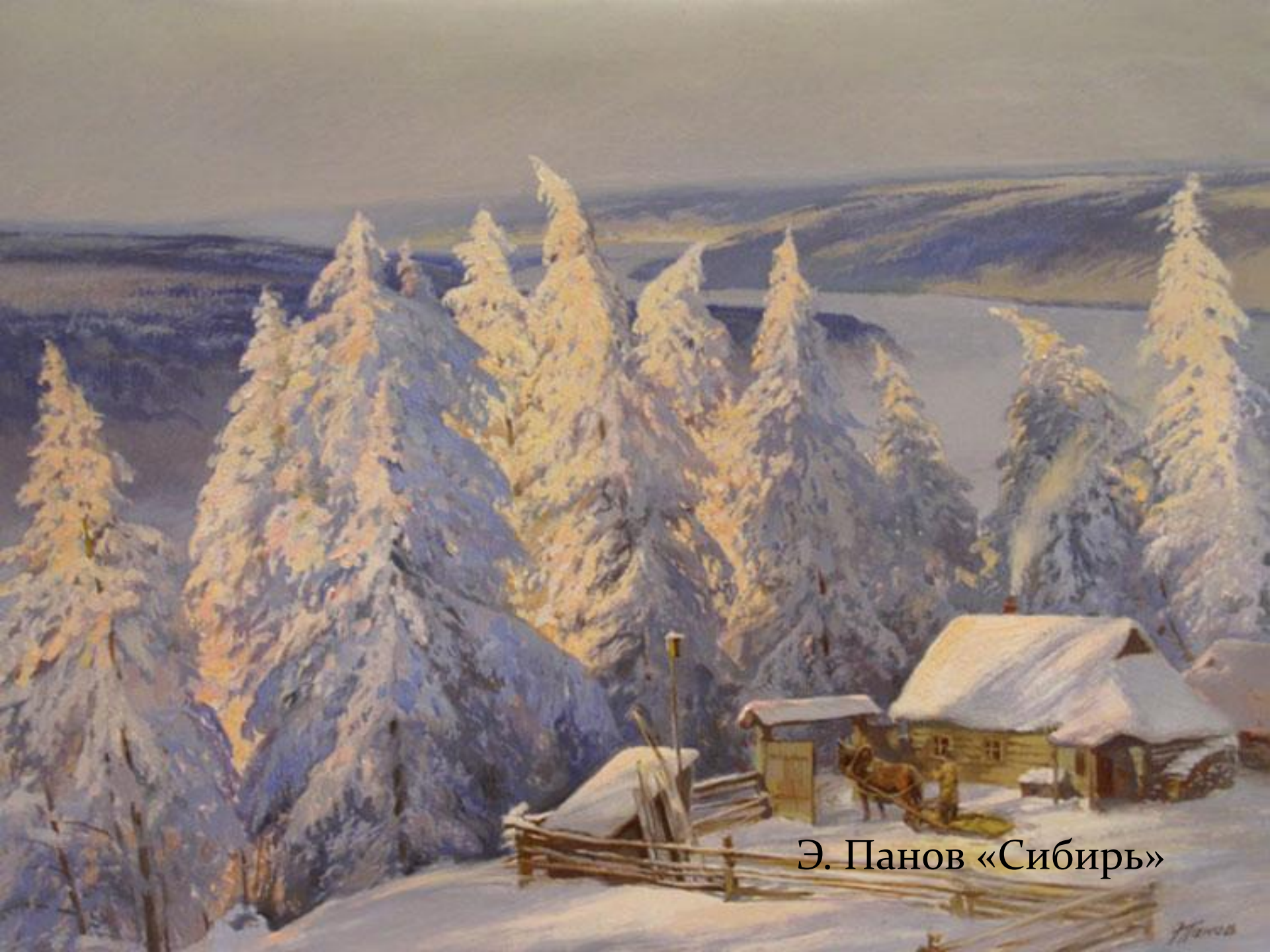
Э. Панов «Сибирь»