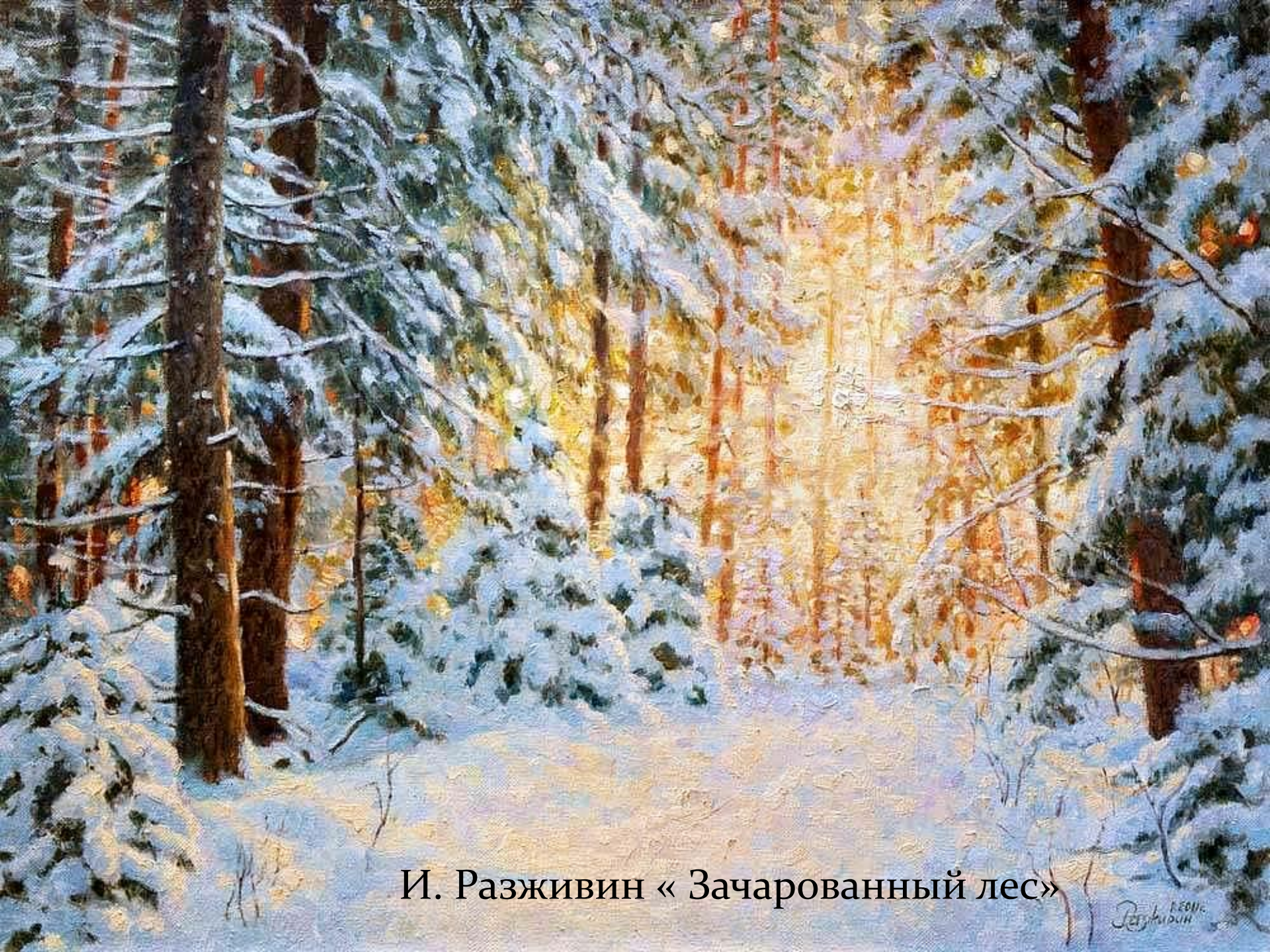
И. Разживин «Зачарованный лес»