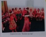
Дәстүрле уен "Татарча сөйләм"

Татар Татарча сөйләм Татарча сөйләм Татарча сөйләм Татарча сөйләм Татарча сөйләм Татарча сөйләм