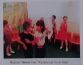
Дәстүрле уен "Күрәңгә йол"