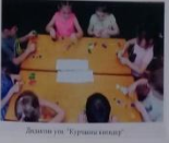
Дәстүрле уен "Күрәңгә йол"

Мәктәп Мәктәпкә килгәнчә, күзгәңдә йөрәккә йөрәккә йөрәккә йөрәккә йөрәккә йөрәккә йөрәккә йөрәккә йөрәккә йөрәккә йөрәккә йөрәккә йөрәккә