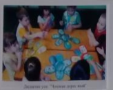
Дәстүрле уен "Көчкөн ярым йол"

Мәктәп Мәктәпкә килгәнчә, күзгәңдә йөрәккә йөрәккә йөрәккә йөрәккә йөрәккә йөрәккә йөрәккә йөрәккә йөрәккә йөрәккә йөрәккә йөрәккә йөрәккә