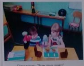
Дәстүрле уен "Татарча сөйләм"

Татарча сөйләм Татарча сөйләм Татарча сөйләм Татарча сөйләм Татарча сөйләм Татарча сөйләм Татарча сөйләм