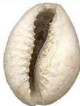
Раковина Каури Трактат по фотографии №00015-200-0004