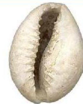
Раковина Каури Трактат по фотографии №00015-200-010-4