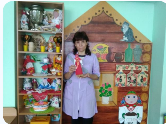
Уголок русской избы