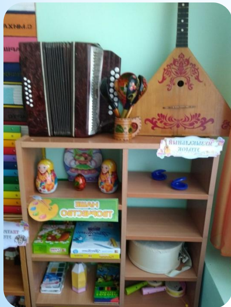
Музыкальный уголок и уголок творчества