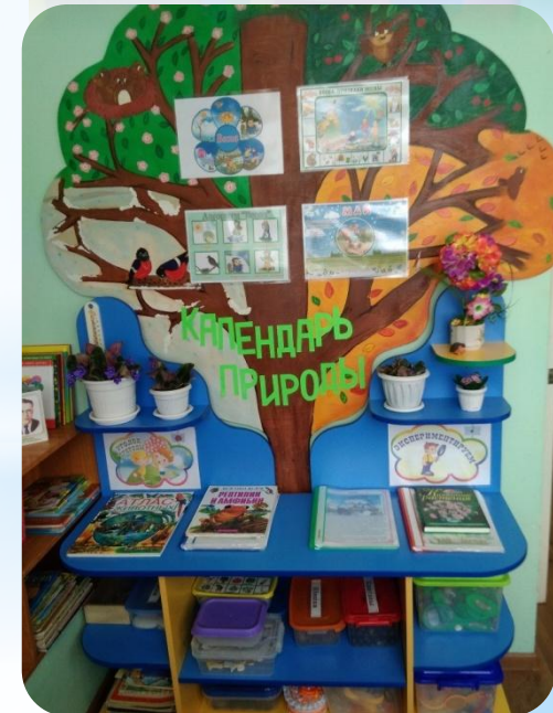
Уголок природы и экспериментирования