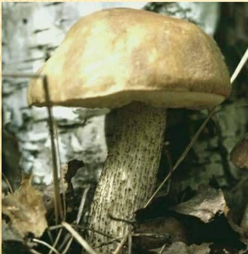
ПОД берёз ОВИК