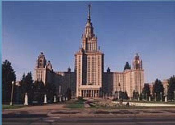
Здание МГУ. им М. Ломоносова.

Москва- столица Российской Федерации. Год основания- 1147 год. Основатель - Юрий Долгорукий.