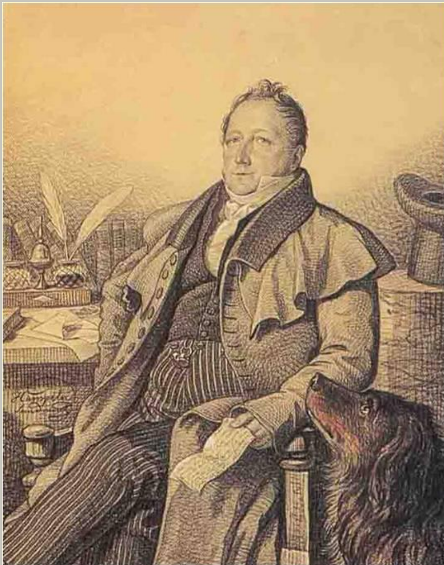
Сергей Львович Пушкин