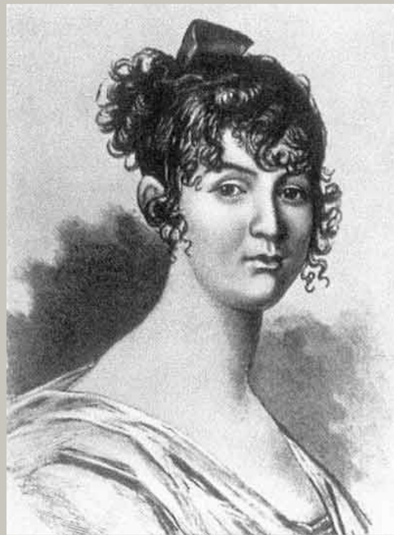
Надежда Осиповна Пушкина (Ганнибал)