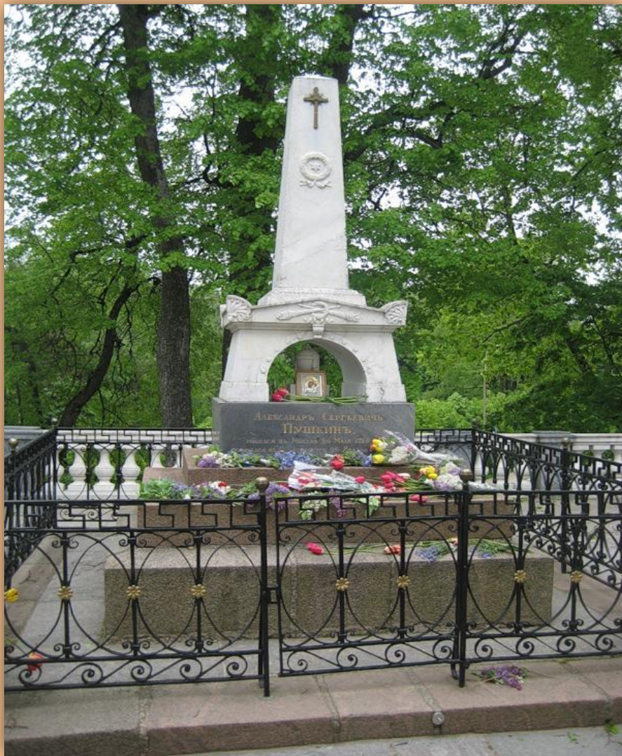
Могила А.С. Пушкина в Святогорском монастыре