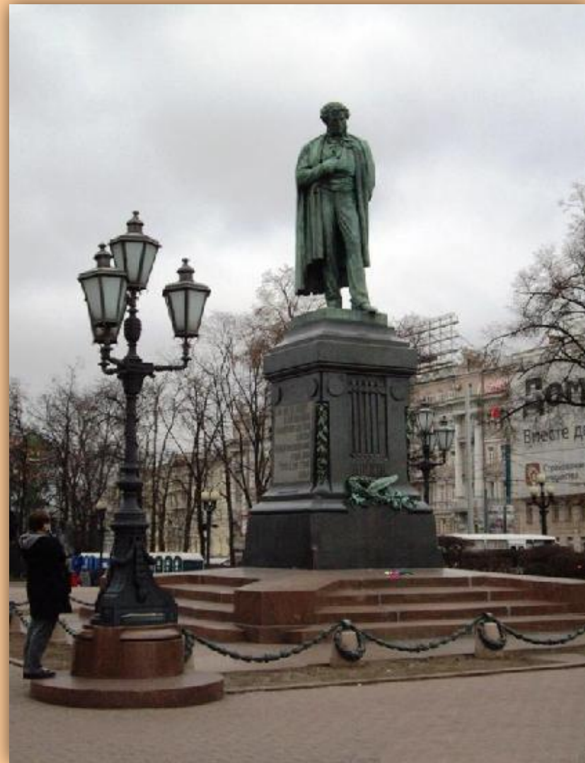
Памятник А.С. Пушкину в Москве