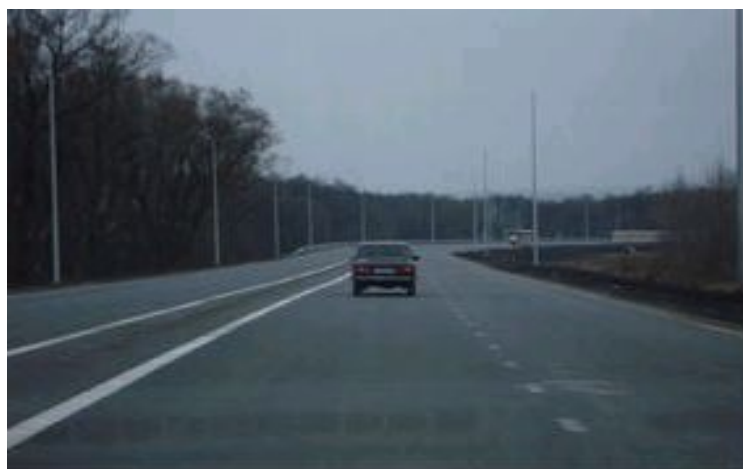
Автодорога 1Р189 в районе Старого Оскола

Климат мягкий, умеренный с продолжительным солнцестоянием (до 1800 часов в год, для сравнения в Сочи – 2185 часов) и большим безморозным периодом, плодородными черноземами (более 70% всех земельных угодий), запасами полезных ископаемых