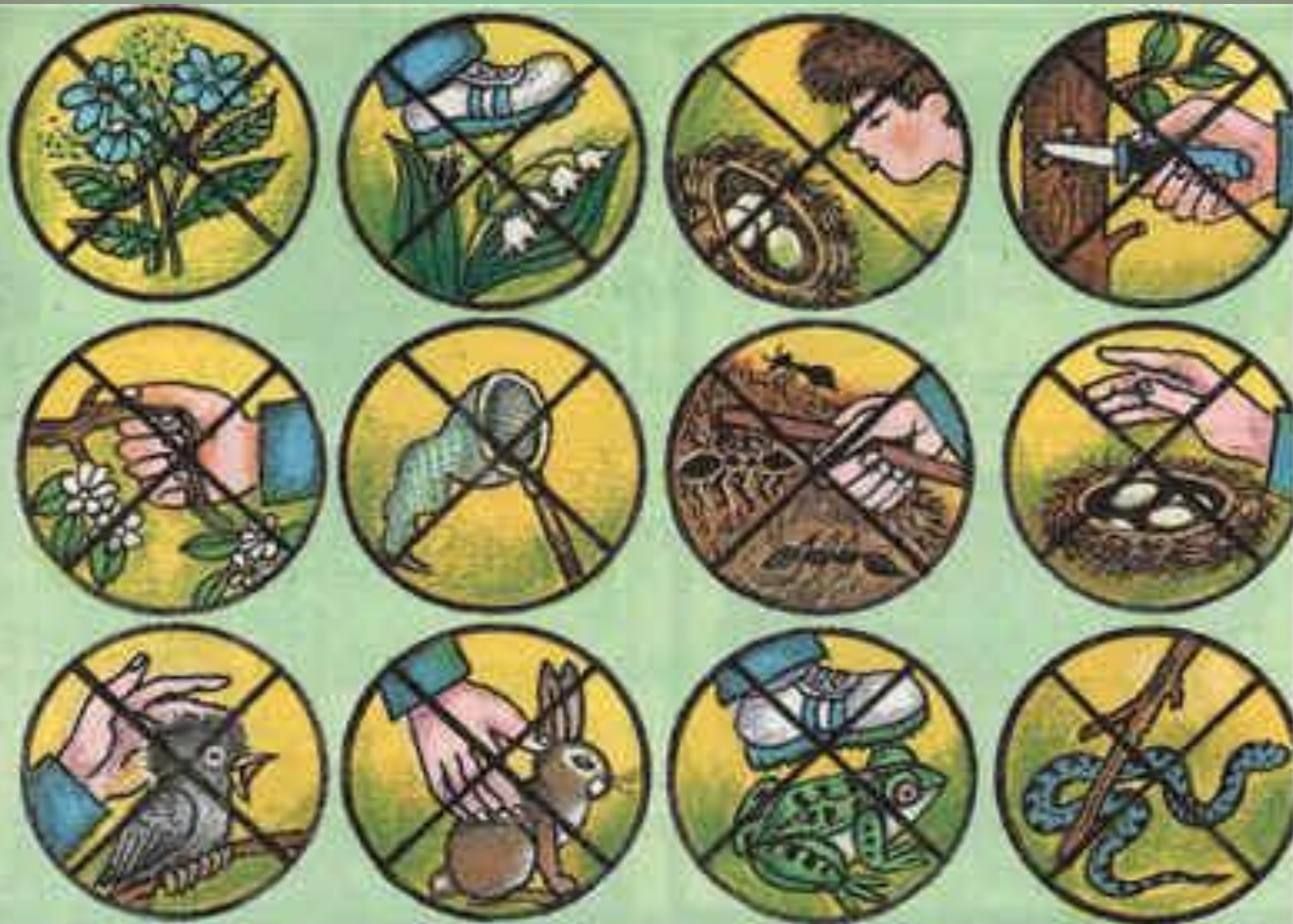
Какие Правила Друзей Природы представлены этими знаками?