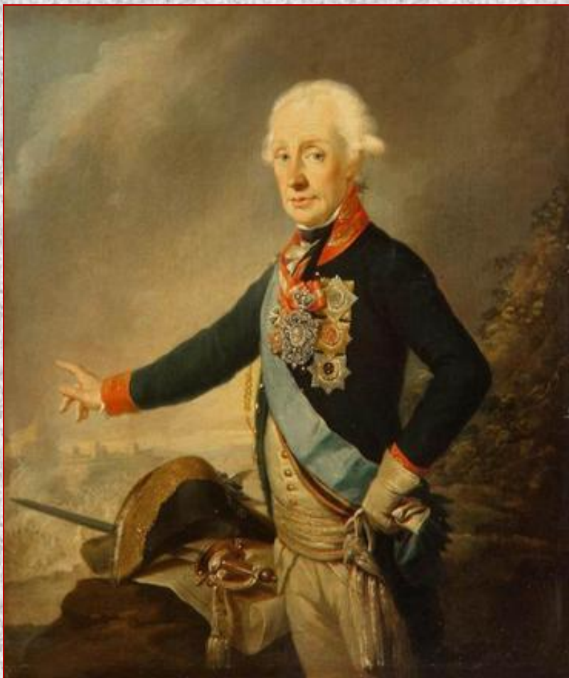
Портрет. Александр Васильевич Суворов