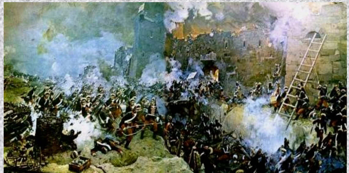
Штурм Измаила. 1790 год