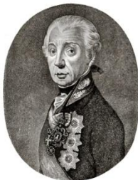
ГЕНЕРАЛИССИМУСЪ КНЯЗЬ ИТАЛІЙСКІЙ Гр. Александръ Васильевичъ СУВОРОВЪ-РЫМНИКОВЪ.

Гу, отъ Него побѣда. Чудо-богатыри, Богъ насъ водитъ, Онъ намъ Генералъ!