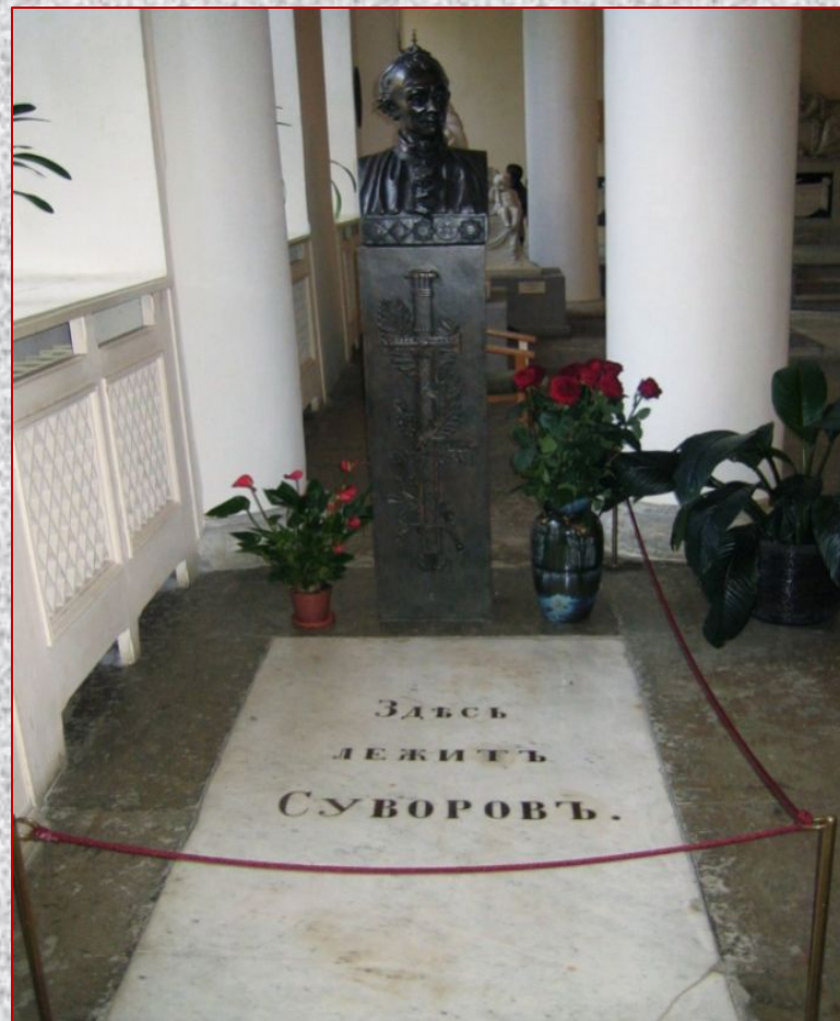
Могила А.В.Суворова в Александрo-Невской лавре