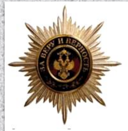
Покорение крепости Кинбурн, 1787, орден Андрея Первозванного