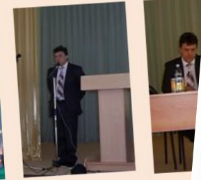
ОТКРЫТИЕ О ПРАКТИЧЕС