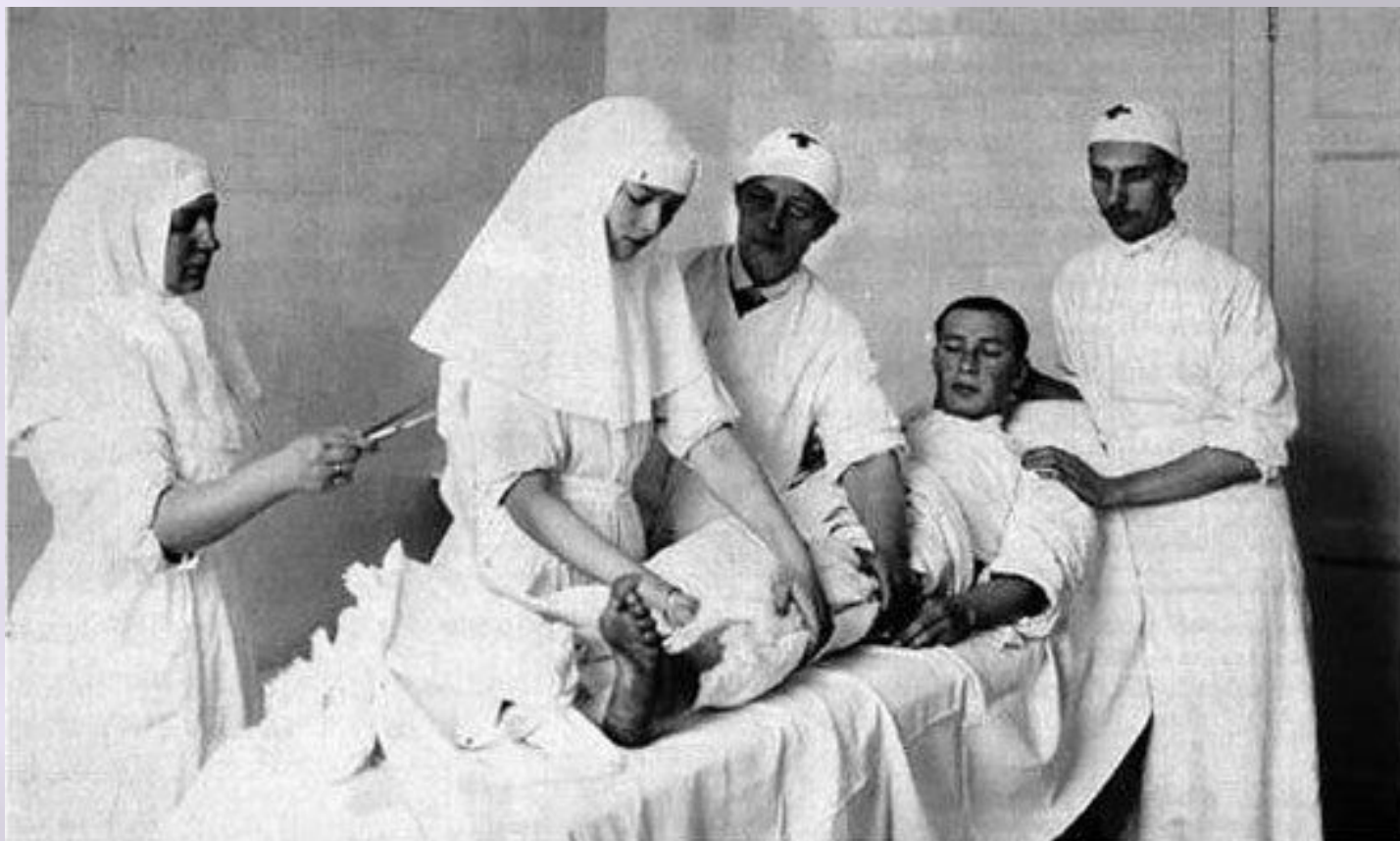
Великая княжна Ольга Николаевна во время перевязки раненого солдата, 1915 год