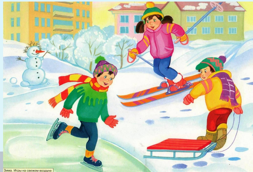
Зима. Игры на свежем воздухе