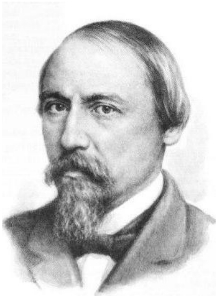
Николай Александрович Некрасов