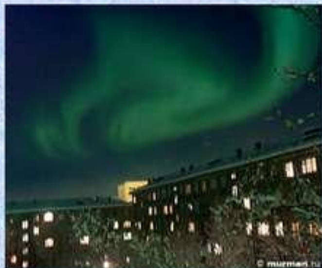
Полярная ночь Северное сияние