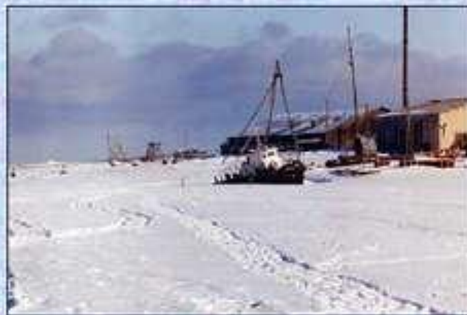
Замерзающее Белое море