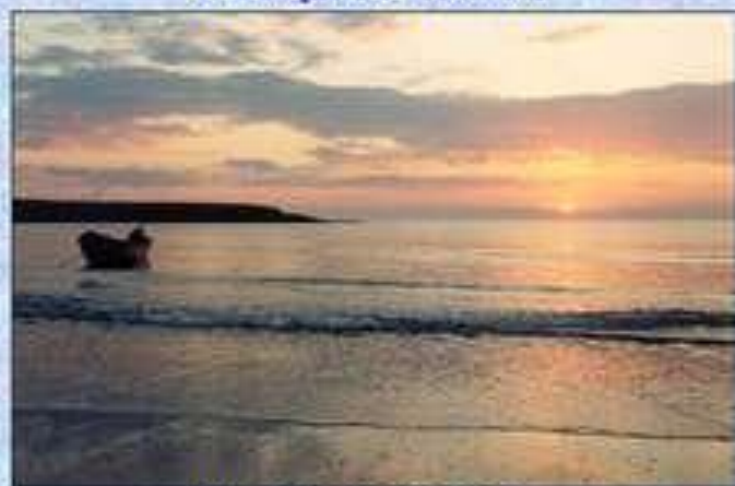
Незамерзающее Баренцево море