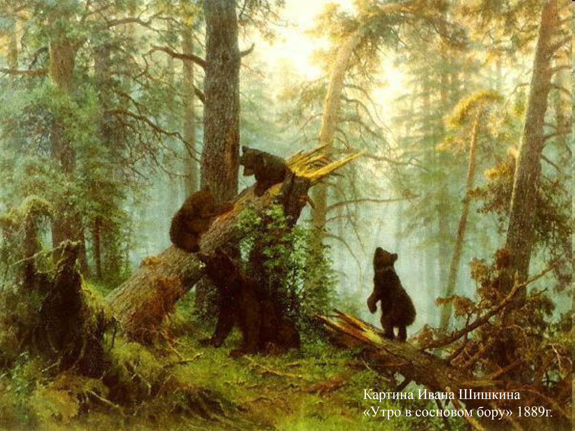
Картина Ивана Шишкина «Утро в сосновом бору» 1889г.