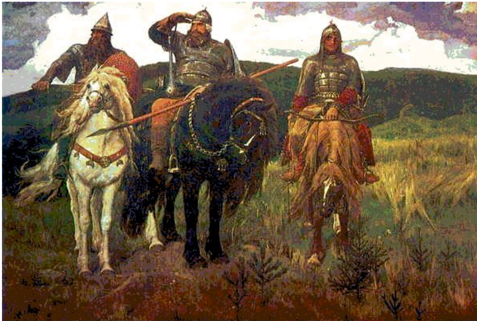
«Богатыри» 1881-1898 год