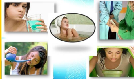
Использование соли в народной медицине

В косметологии широко применяется вся гамма морских солей, которые входят в состав множество кремов, масел, шампуней.