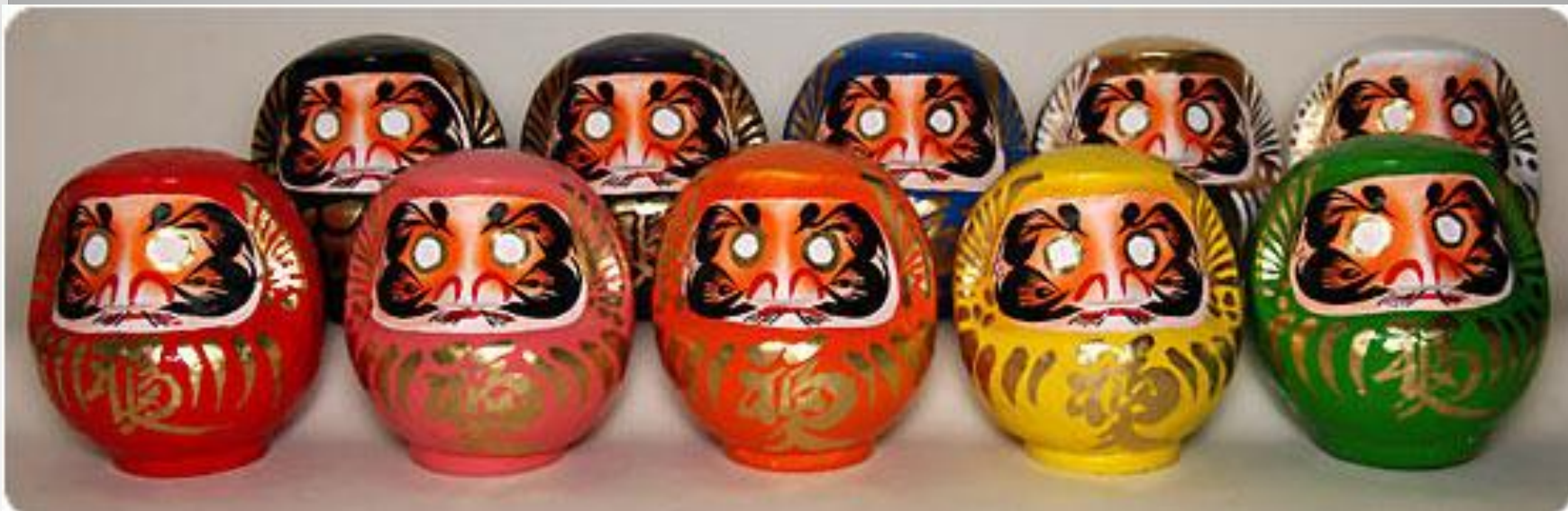
Японская кукла Дарума