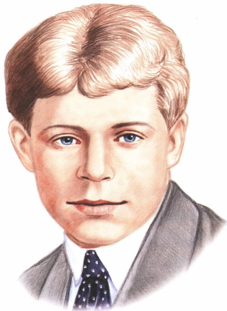
Есенин Сергей Александрович (1895-1925)