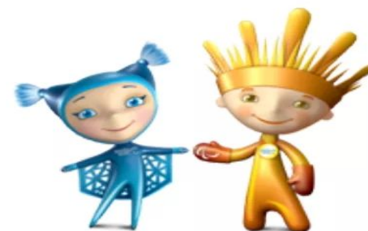
Снежинка и Лучик