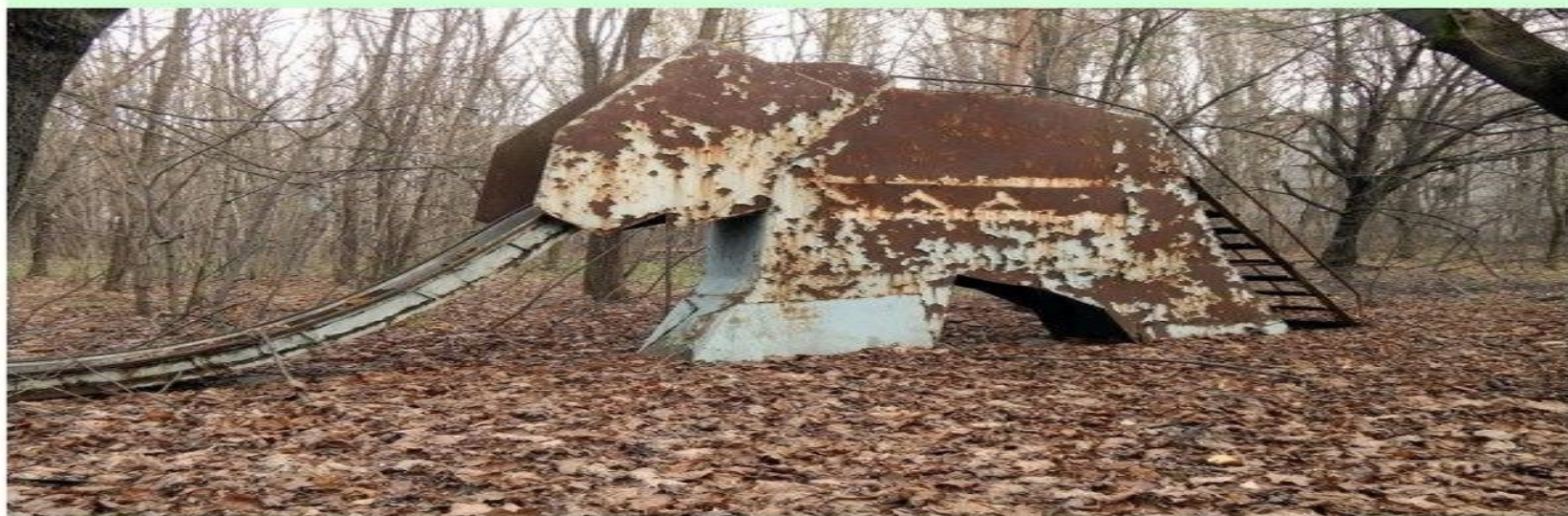
Она же, правда с другой стороны, в ноябре 2013 года.