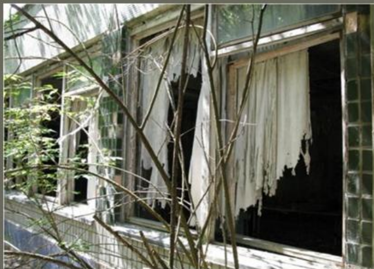
Так выглядит здание школы