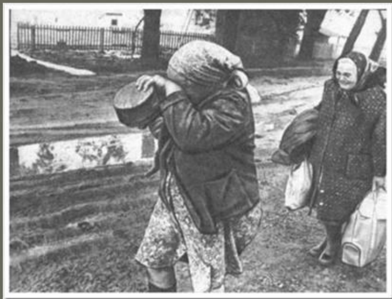
Жители покидают родные места