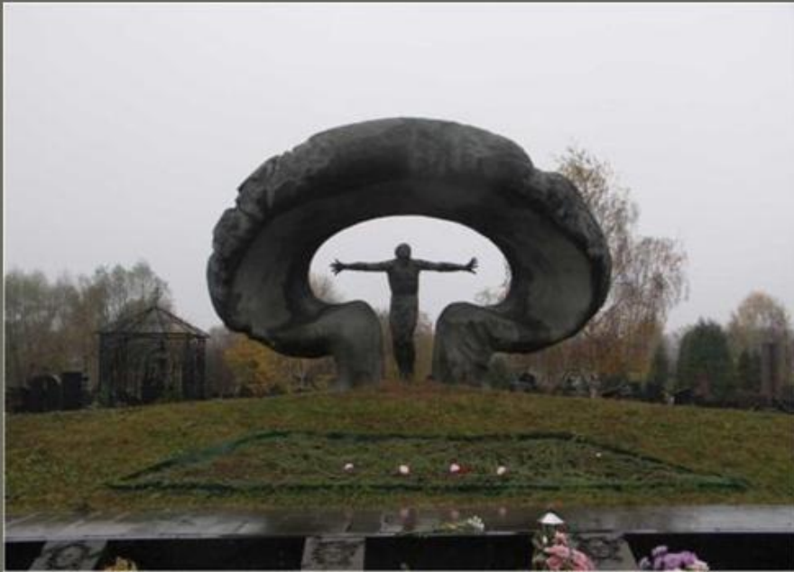
Памятник ликвидаторам на Митинском кладбище в Москве