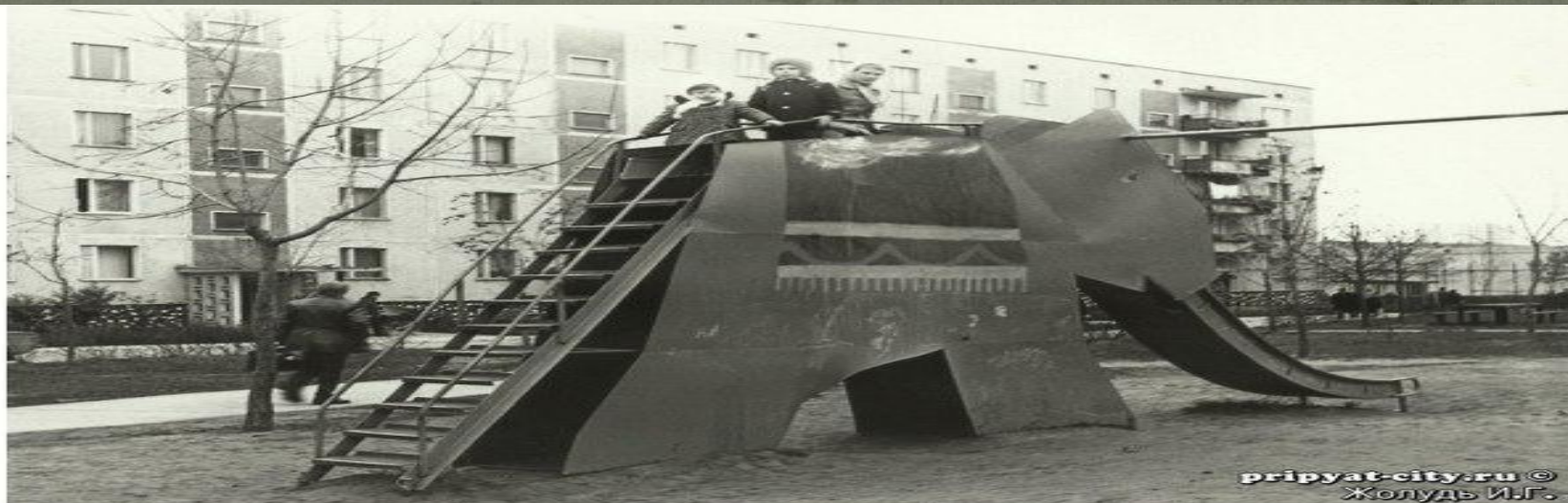
8. Детская горка в виде слона во дворах первого микрорайона.