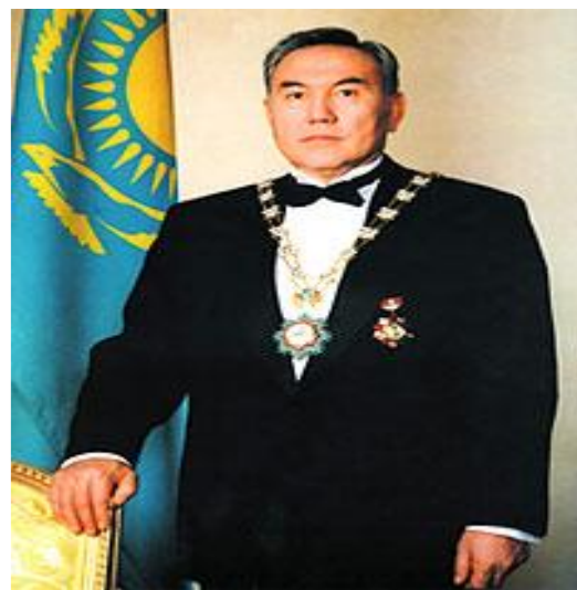
Нұрсұлтан Әбішұлы Назарбаев