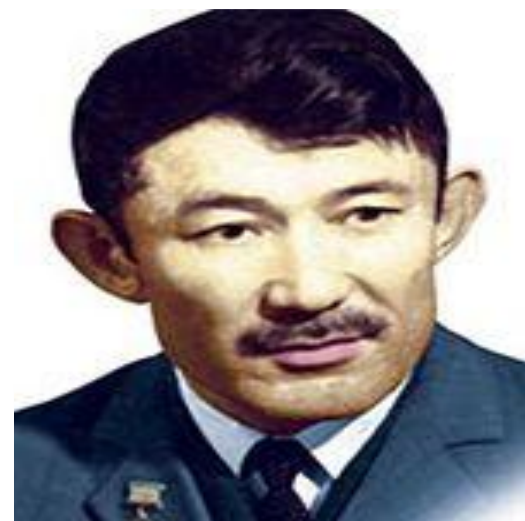
Композиторы: Шәмші Қалдаяқов