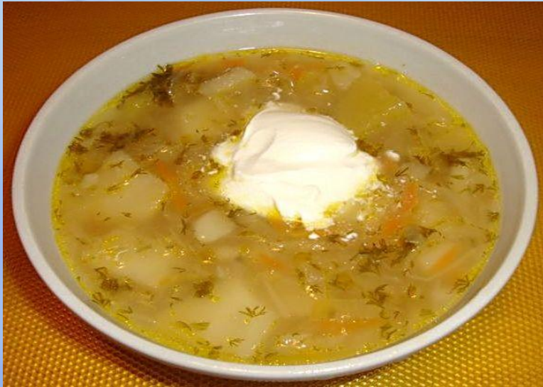
щи со сметаной