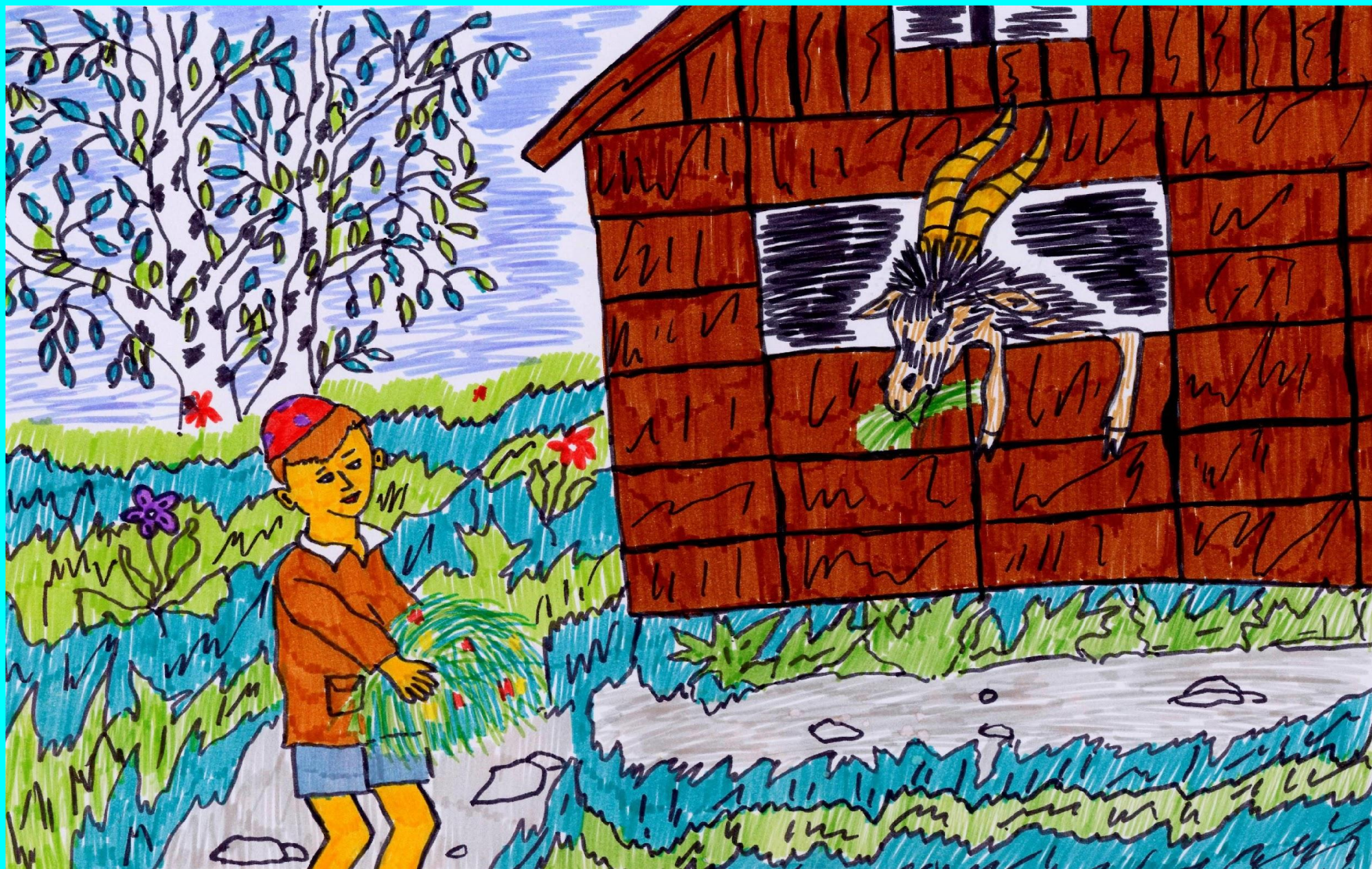
• Гали белән Кәжә