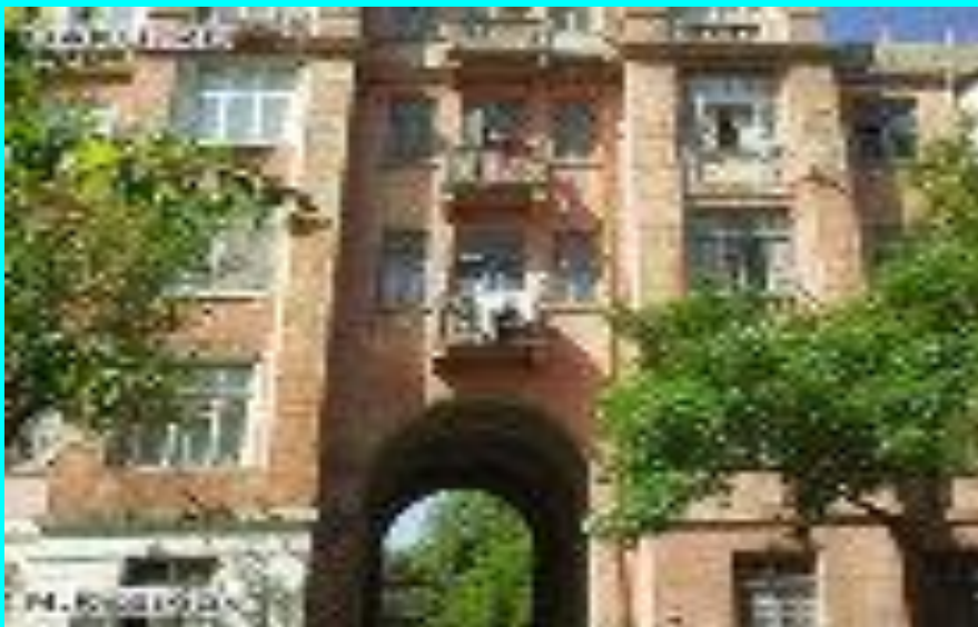
Габдулла Тукай урамы