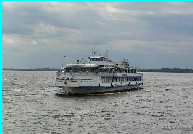
Габдулла Тукай исемендәге теплоход