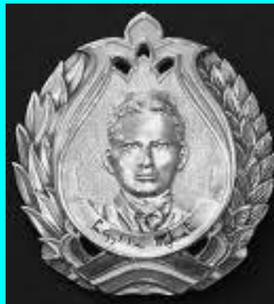
Габдулла Тукай премиясе