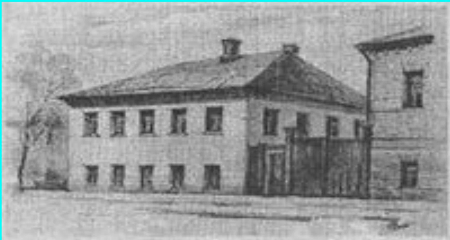
Уральскида. Гәлиаскәр Усманов өе.