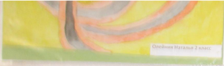
Олейник Наталья 2 класс