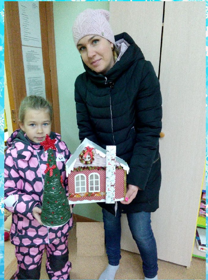
Заучивание стихов с детьми к новогоднему утреннику; Постройка горки; Помощь в украшении группы Выставка «Новогодние поделки»