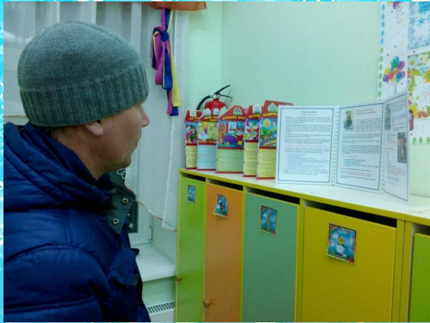
Папка-передвижка «Безопасный Новый год»;