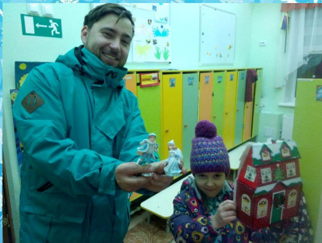
Участие в создании макета «Как встречают Новый год в Канаде»;