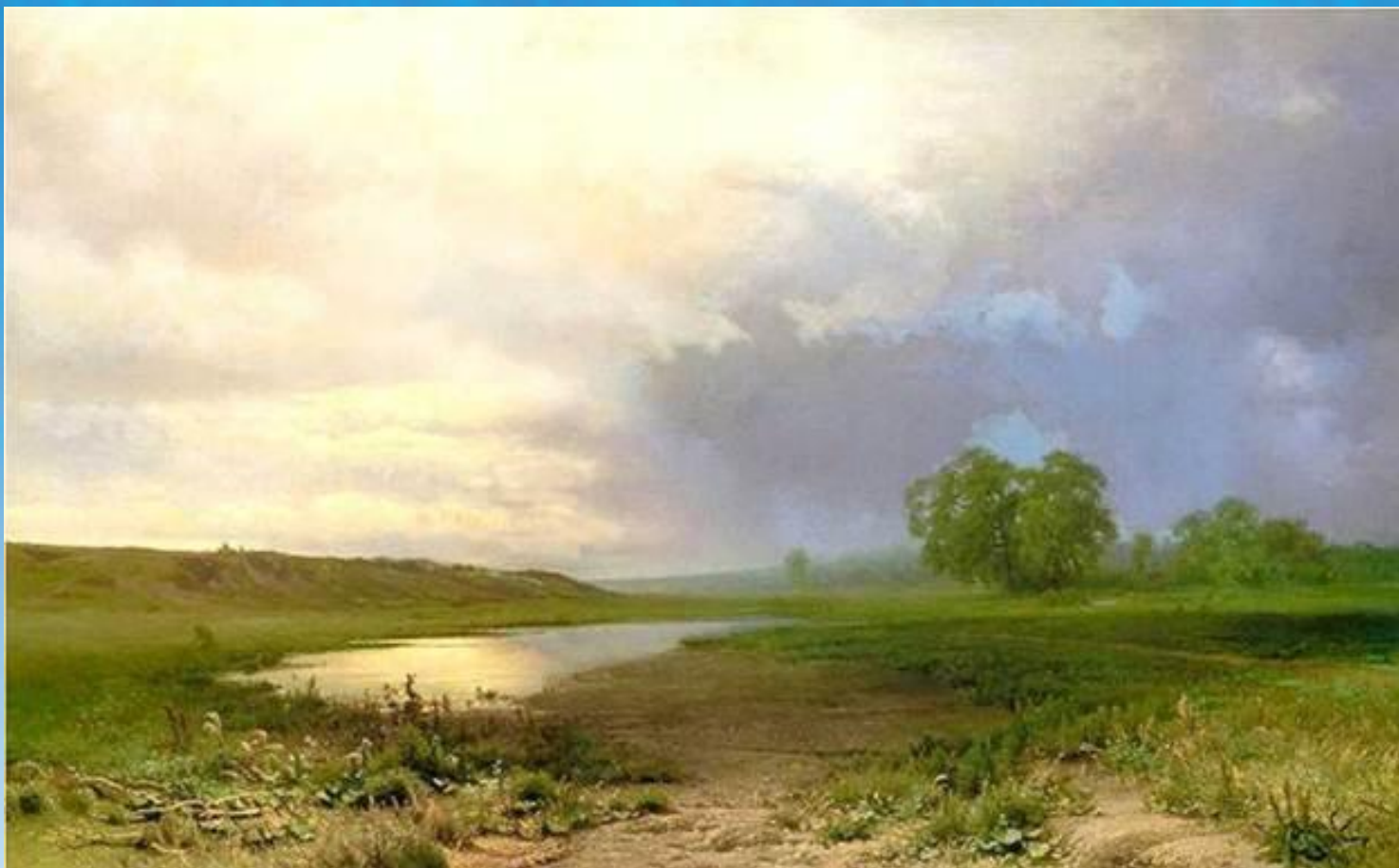
Ф. А. Васильев «Мокрый луг»