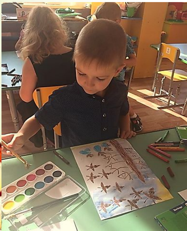
Восковые мелки + акварель

Нетрадиционные изобразительные техники, наиболее доступные, понятные и интересные ребенку старшего дошкольного возраста.