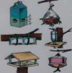
Другие виды кормушек