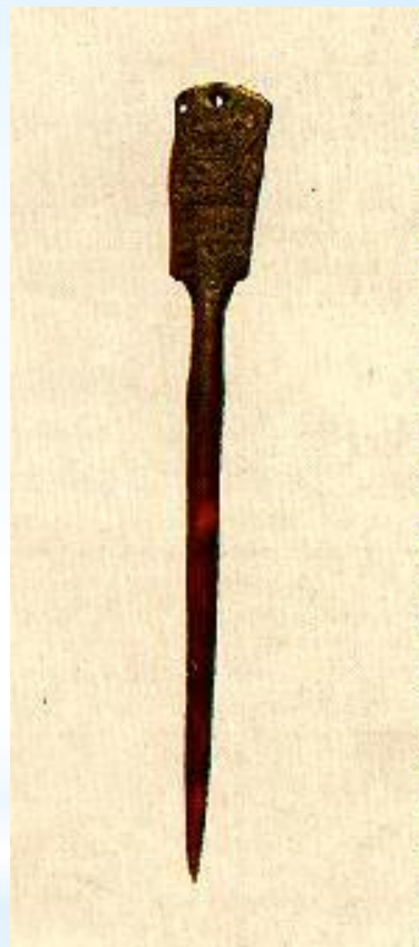
Бронзовые писала, найденные в Киевской области (Древняя Русь X-XII века)