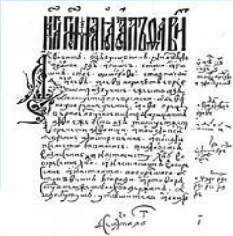
« Азбуковник » XVI века состоял из слогов, прописей, сведений по грамматике и арифметике.