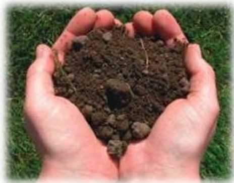
Почва, богатая питательными веществами