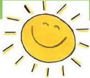
Свет и тепло