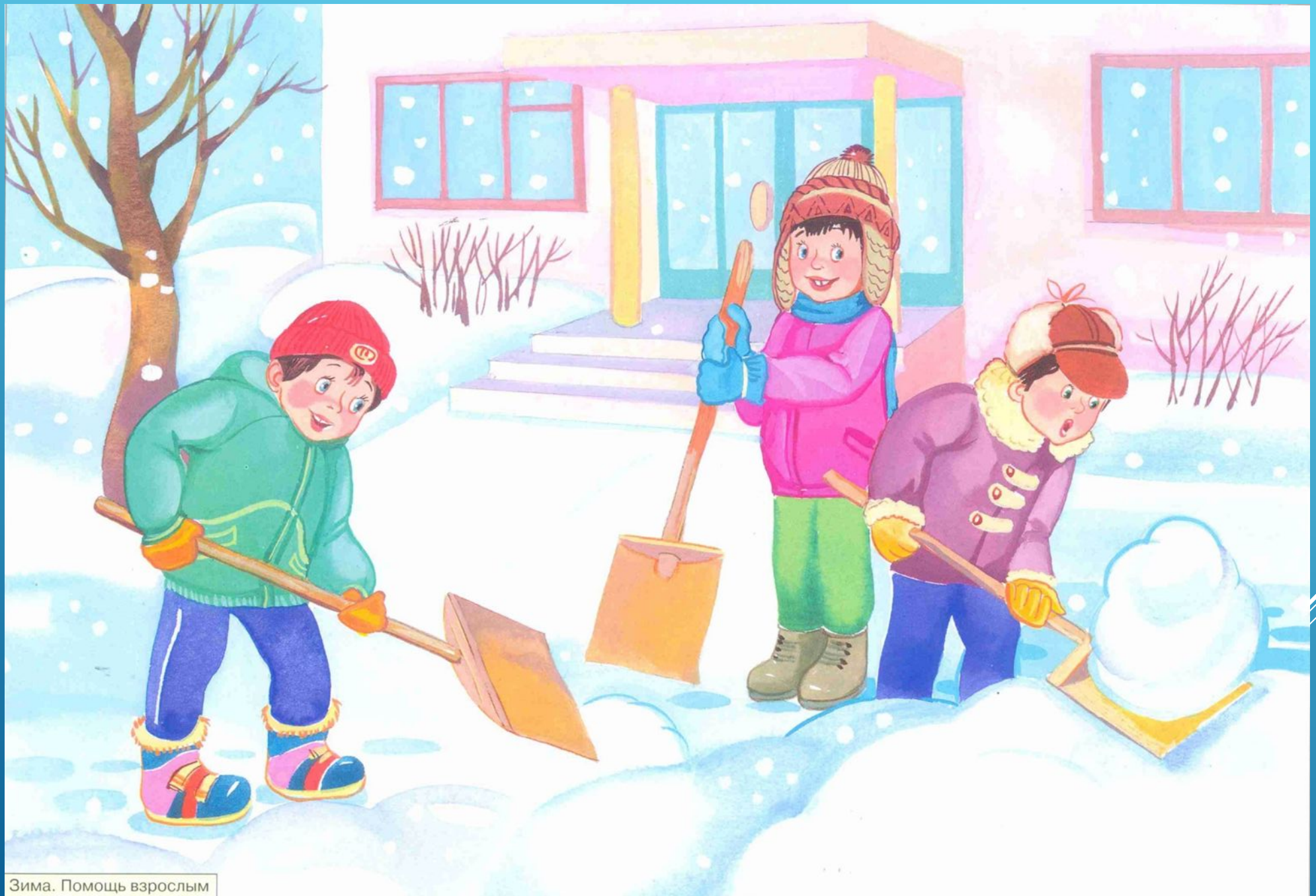
Зима. Помощь взрослым