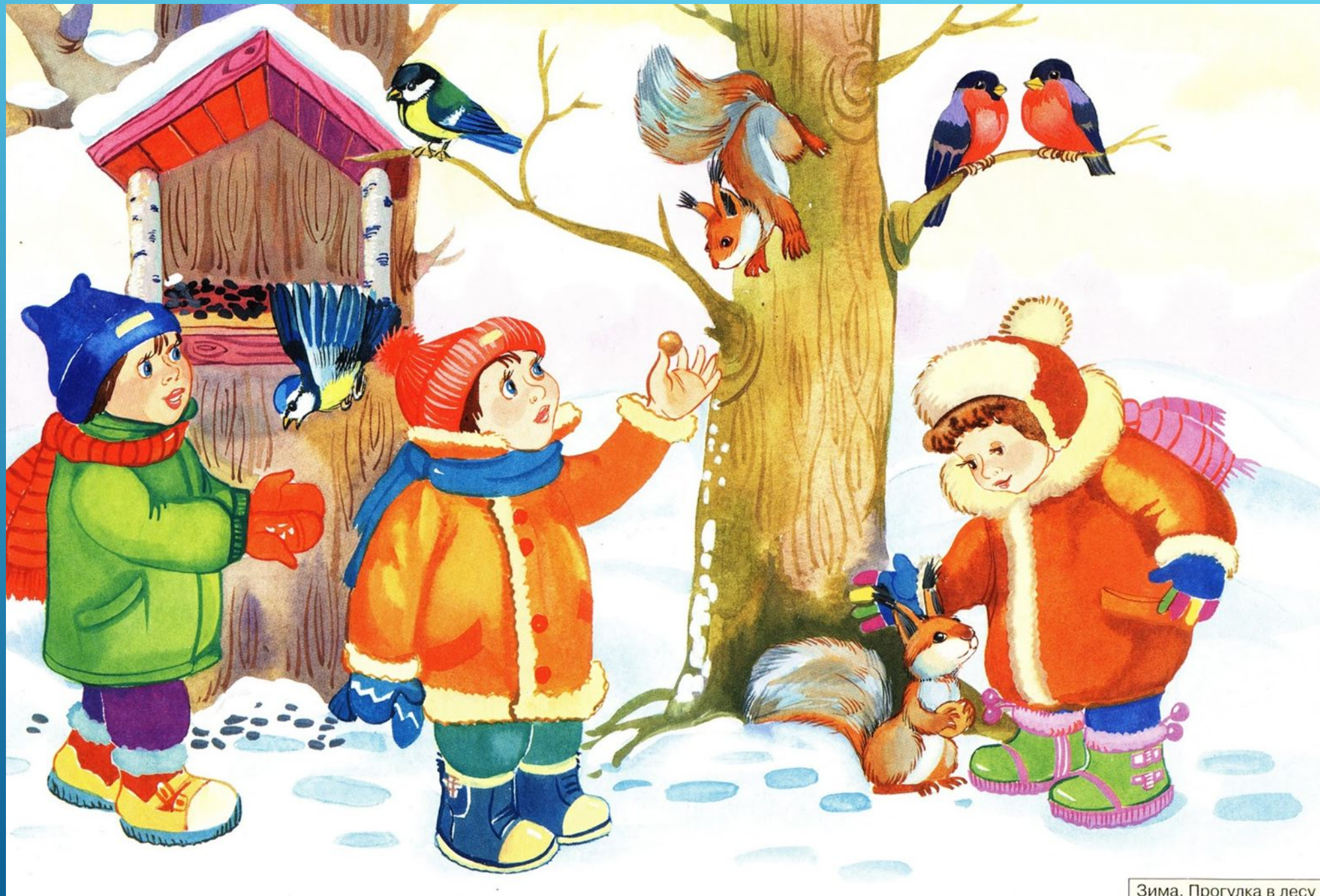
Зима. Прогулка в лесу