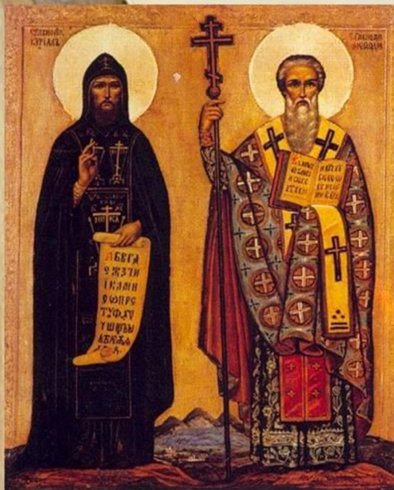
Кирилл и Мефодий

Кирилл и Мефодий, славянские просветители, создатели славянской азбуки, проповедники христианства, первые переводчики богослужебных книг с греческого на славянский язык. Кирилл (до принятия монашества в 869 - Константин) ( 827 - 14.02.869 ) и его старший брат Мефодий ( 815 - 06.04.885 ) родились в г. Солуни в семье военачальника.