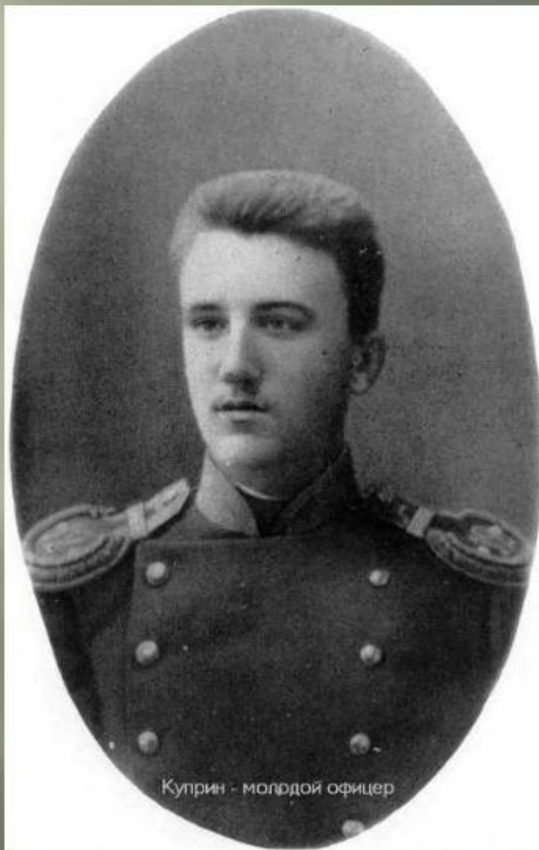
Куприн - молодой офицер