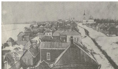
Жәек. Галиәсгар (жизнәсе)