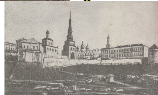
Казан. Мөхәммәтвәли һәм Газизә гаиләсе