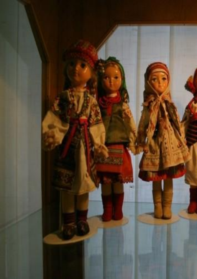
Исторические города России