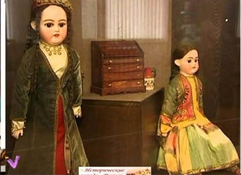
Исторические города России