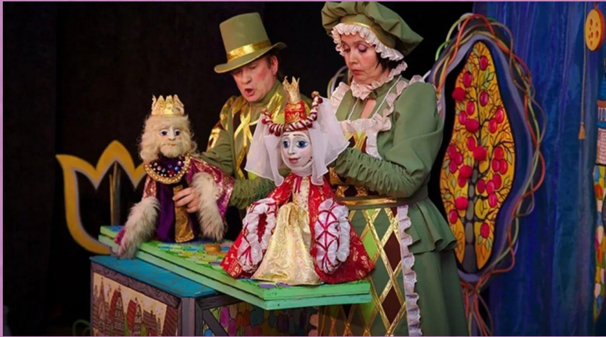
Тростевые куклы. Актёр управляет руками куклы с помощью тонких палочек – тростей

В нем, куклы сами пишут пьесы в стихах и сами в них играют. На современной сцене кукольного театра куклы могут играть вместе с актёрами. Это замечательный театр, и куклы там бывают самые разные.