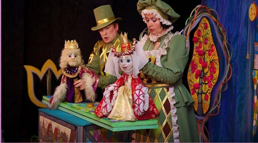
Тростевые куклы. Актёр управляет руками куклы с помощью тонких палочек – тростей

В нем, куклы сами пишут пьесы в стихах и сами в них играют. На современной сцене кукольного театра куклы могут играть вместе с актёрами. Это замечательный театр, и куклы там бывают самые разные.