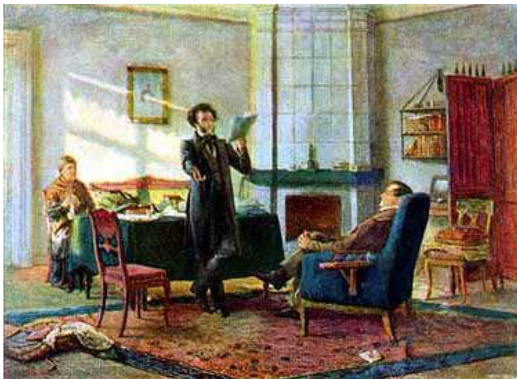
Пушкин в селе Михайловском (Пушкин у Пушкина). Н.Н. Ге. 1875 г.

За три года ссылки написаны "Кавказский пленник", "Бахчисарайский фонтан", а также "Узник", "Песнь о Вещем Олеге". Начат роман в стихах "Евгений Онегин".