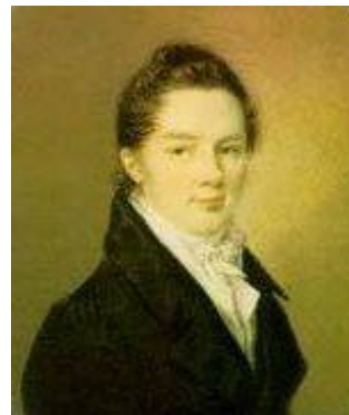
Иван Иванович Пуцин

Пушкин сохранил лицейскую дружбу и культ Лицея на всю жизнь.