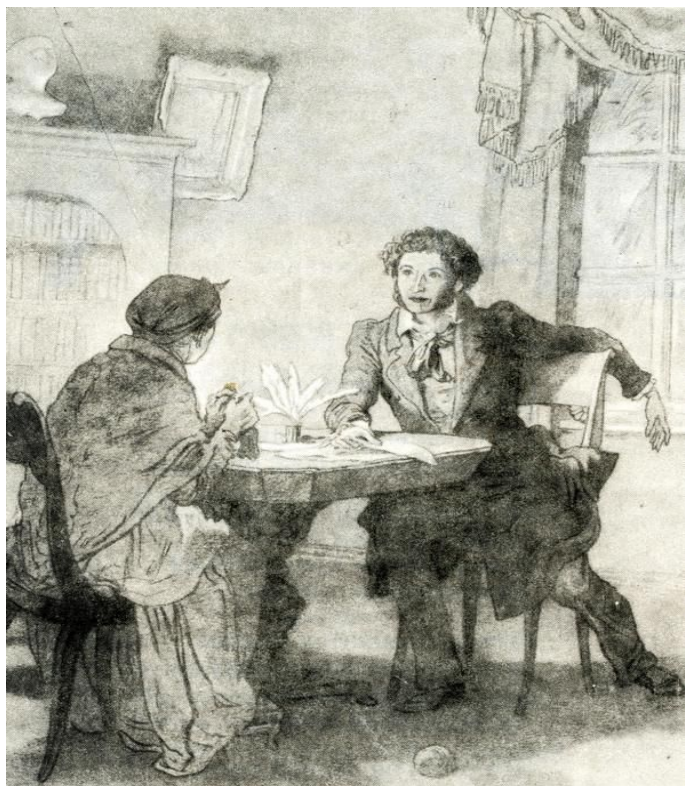
Иллюстрация к стихотворению «Зимний вечер»

Забота и любовь Арины Родионовны скрашивали поэту ссылку. Пушкин по-настоящему крепко любил свою няню и написал несколько трогательных стихотворений, к ней обращенных.