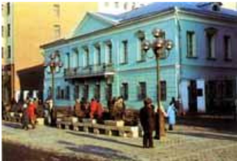
Квартира Пушкина в Москве на Арбате

С середины октября 1831 г. и уже до конца жизни Пушкин с семьей живет в Петербурге.