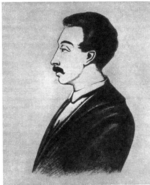
Вильгельм Карлович Кюхельбекер