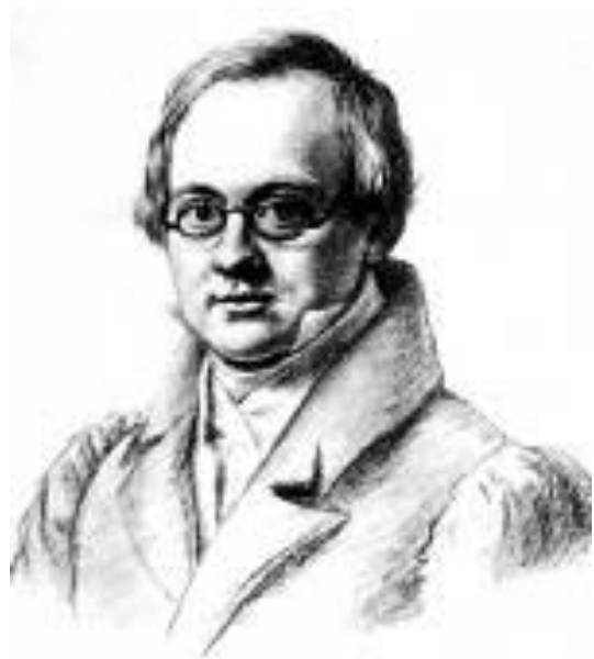
Антон Антонович Дельвиг