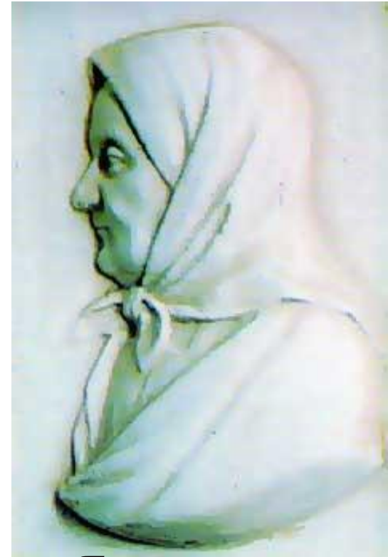
Яковлева Арина Родионовна

Любовь к родному языку маленькому Пушкину привили бабушка, Мария Алексеевна Ганнибал, превосходно говорившая и писавшая по-русски, и няня Арина Родионовна.