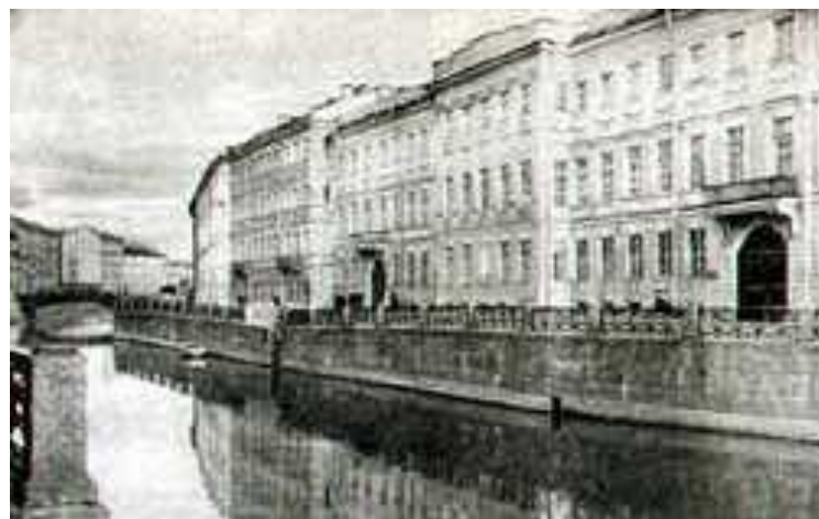
Квартира Пушкина в Петербурге на Набережной Мойки

18 февраля 1831 г. в церкви Вознесения Господня состоялось его венчание с Н. Н.Гончаровой. Первые месяцы семейной жизни он провел с женой в Москве, сняв квартиру на Арбате