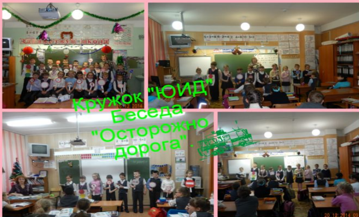
Кружок "ЮИД" Беседа "Осторожно дорога"