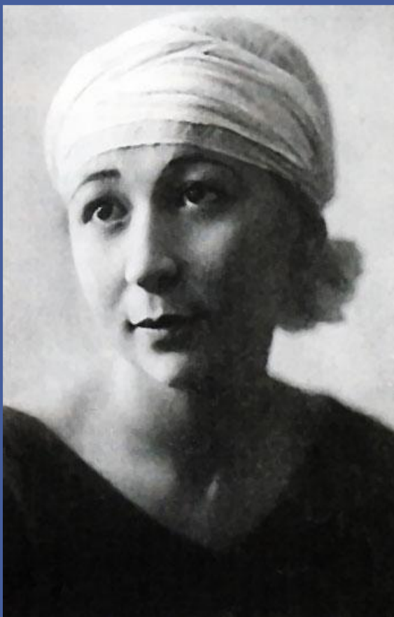
«Эшче» . 1926-1927 еллар.