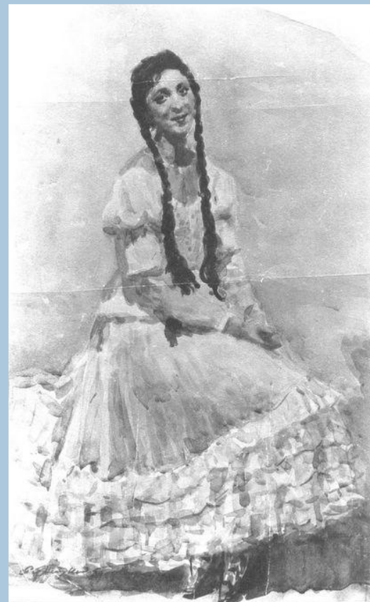
Балерина Ә. Айдарская портреты 1934 ел.