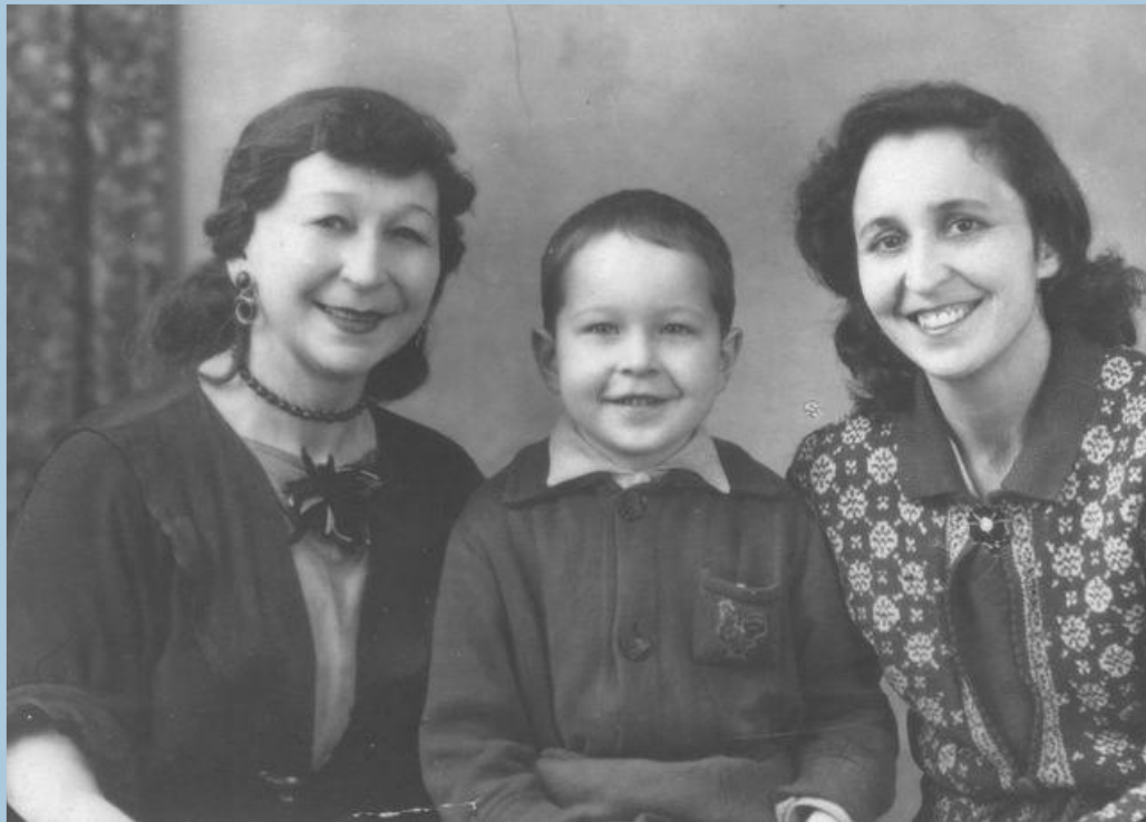
Кызы һәм оныгы белән. Казан шәһәре 25.12.1958 ел.