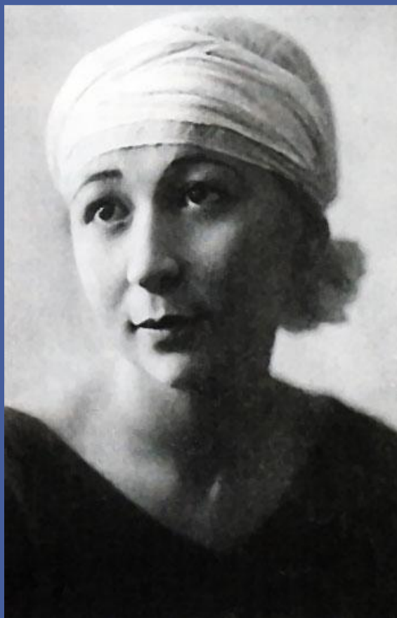
«Эшче» . 1926-1927 еллар.