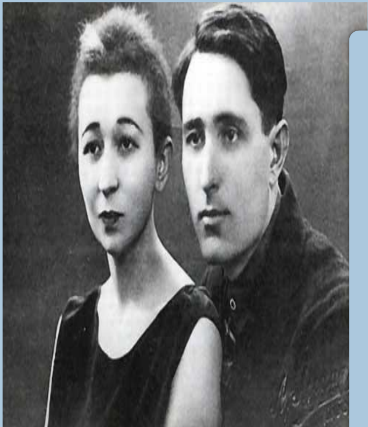
Ире Г. Айдарский белэн. 1924 ел.