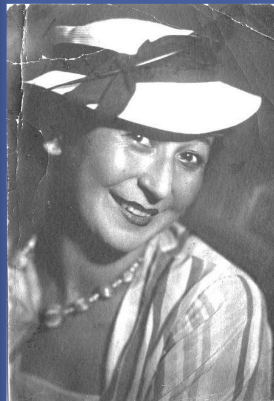
Татар опера студисен тәмамлаганнан соң. 4.11.1938 ел.