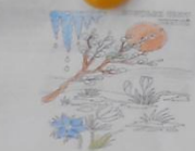
Привет! Весна и весенние месяцы