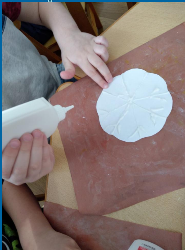
Рисунок произвольный, по желанию детей