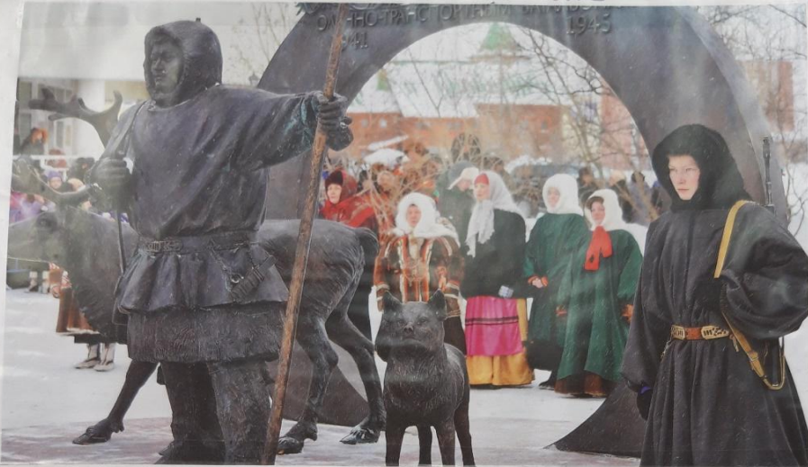
Памятник «Подвигу участников оленно-транспортных батальонов в годы Великой Отечественной войны»

Проект "Памятники своего города, посвященные Великой Отечественной войне"