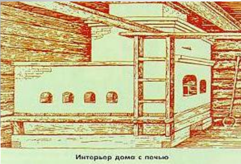
Интерьер дома с печью