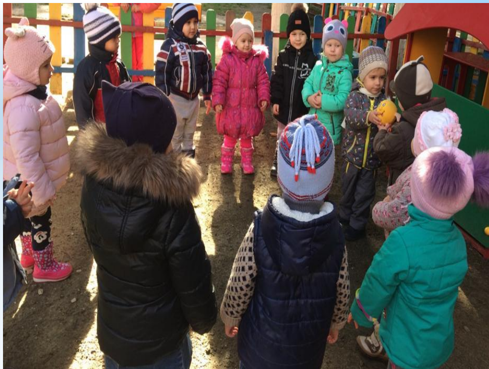
Игровое упражнение «Догони Колобка»